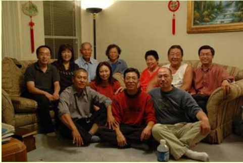
周間聚會的蒙恩團契