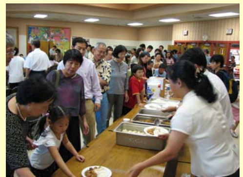
午餐有時會有點擁擠