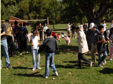
朗朗的歌聲及蘋果雨